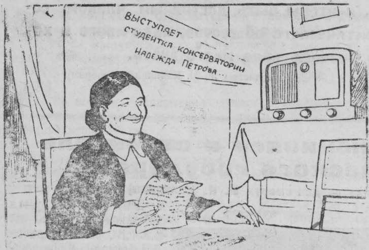
—От сына из института письмо получила, а дочка по радио свой голос подает.