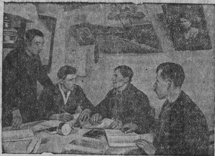
Правление колхоза обсуждает план работы.

Крестьяне деревни Комаровка Нарвской волости организовали колхоз „Красная Комаровка“. Это один из первых колхозов в Советской Эстонии. В сельскохозяйственную артель вступило 69 человек; она располагает 380 гектарами земли.