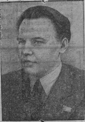
Кандидат в члены Политбюро ЦК ВКП(б) Н. А. Вознесенский.

Сейчас коллектив учителей приступил к изучению материалов VIII сессии Верховного Совета СССР.