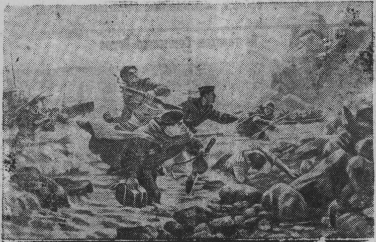
На снимке: „Десант на Курильских островах“. Репродукция с картины художника А. И. Плотнова.