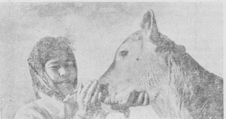
Хозяйство Лизы пополнилось.

— Пусть всегда будут щедрыми твои руки!—говорит старейший колхозник.