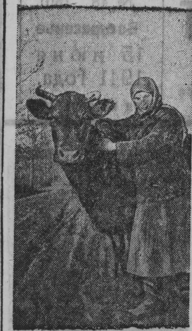
Безкоровные крестьянские хозяйства в Советской Латвии получают скот.

Однако в целом по району в этом году коллективное страхование идет край-