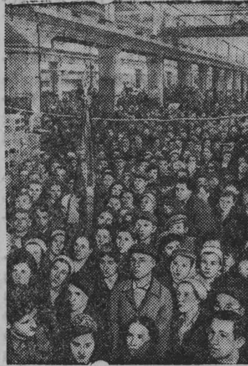
Митинг на Московском заводе „Динамо“ им Кирова в связи с заявлением Заместителя Председателя Совнаркома СССР и Народного Комиссара иностранных дел тов. В. М. Молотова (22 июня 1941 г.).