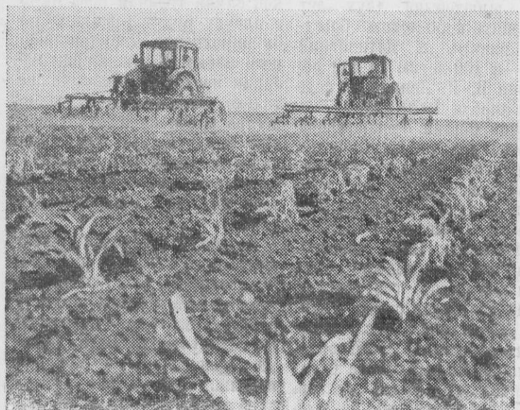
Механизаторы Омской области ведут обработку кукурузы. Хорошие всходы и на полях Еремеевского совхоза (на снимке).

с. Мужа, типография управления по печати Тюменск. обл.сполкома Заказ № 59, тираж 1107 экз.