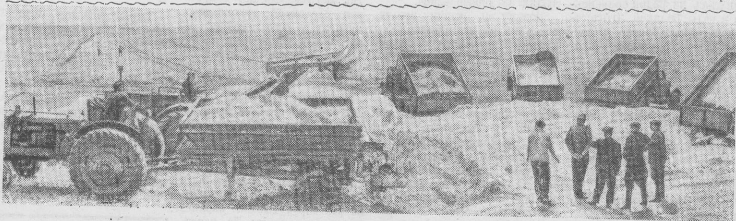
Алтайский край. Второй год специальные механизированные отряды отделения «Сельхозтехники» Кулундинского, Родинского и Благовещенского районов ведут гипсование засоленных почв. В этом году отрядам предстоит провести работы на пло-