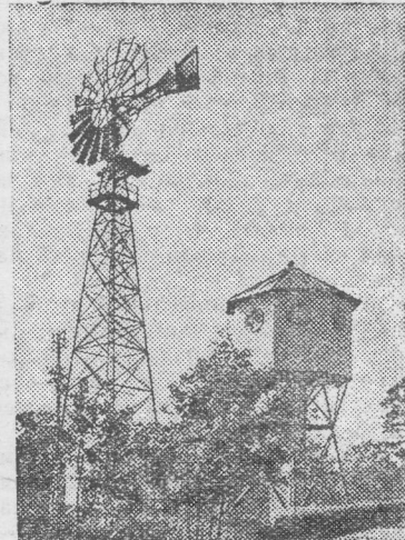
Ветронасосная станция с ветродвигателем „ТВ-8“.