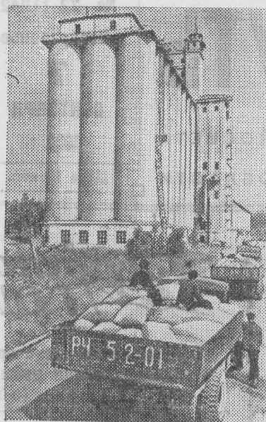
Татарская АССР. На Казанский элеватор непрерывно поступает из колхозов и совхозов республики зерно нового урожая. На снимке: машины с зерном прибыли на элеватор.