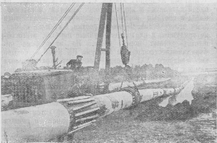
Воронежская область. На территории области ве- дется прокладка второй нити газопровода Ставрополь— Москва. Здесь трудятся коллективы пяти механизиро- ванных колонн строительного управления № 7 треста «Щекингазстрой». Колонны оснащены новейшей техни- кой.

На снимке: монтаж аппаратуры в вакуум-пропиточ- ном цехе.