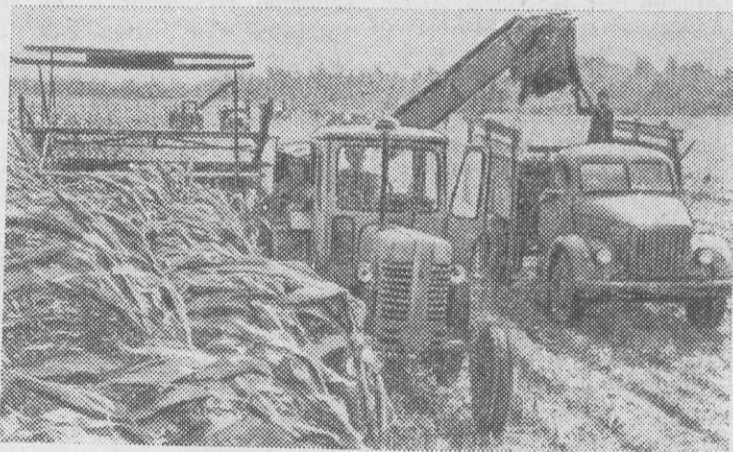
Убирают урожай труженики полей Тюменской области. Снимок сделан в одном из крупных хозяйств — совхозе „Урожайный“.

Вы видите уборку кукурузы. Эта культура размещена на площади в 1.600 гектаров. С каждого из них сибиряки получают более 300 центнеров зеленой массы.