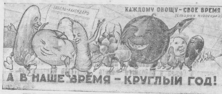
Плакат художника Б. Аржекаева, выпущенный ЦЗОГИЗ.