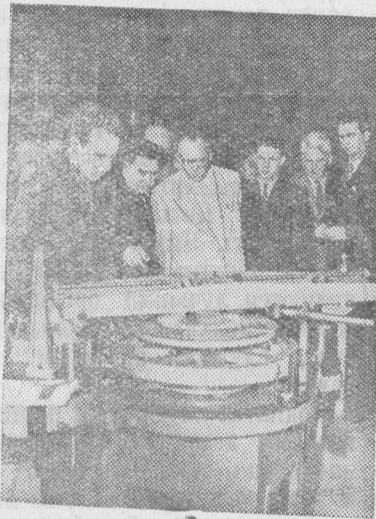
Лейпциг, (ГДР). В сентябре была проведена Международная Лейпцигская ярмарка. Все одиннадцать дней она длилась ярмарка ее павильоны и выставочные площадки были переполнены посетителями. На снимке: премьер-министр ГДР Отто Гротеволь в техническом отделе Советского павильона.

В пятилетнем плане развития народного хозяйства Китайской Народной Республики видное место занимает строительство двух железнодорожных мостов: через речку Янцзыцзян и речку Ханьшуй. Новые мосты через эти реки соединят железные дороги Северного Китая с железными дорогами Южного Китая. На снимке: строительство железнодорожного моста через р. Ханьшуй.