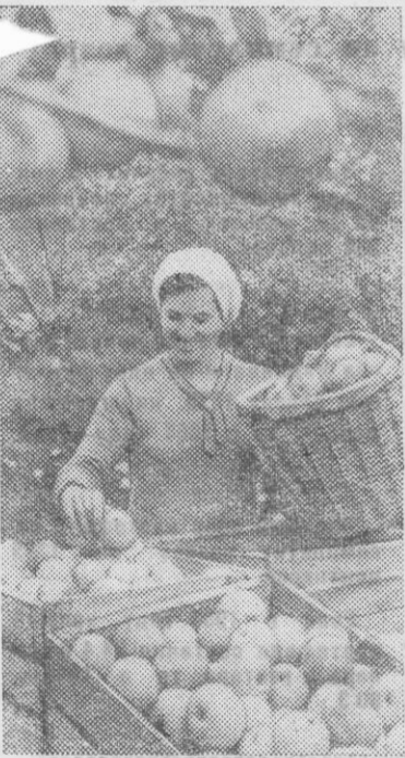
Совхоз имени Мичурина—одно из крупных плодопитомнических хо-

Щенята выросли. Их веселый гомон разносится далеко за ограду зверофермы. Еще недавно слепые и беспомощные, они превратились в крепких красивых зверьков с густым, пушистым мехом. Тесно стало в клетках. А у звероводов прибавилась новая забота. Если раньше они беспокоились, в основном, о сохранении поголовья, сейчас на первый план выступает борьба за мех. Отобраны производители