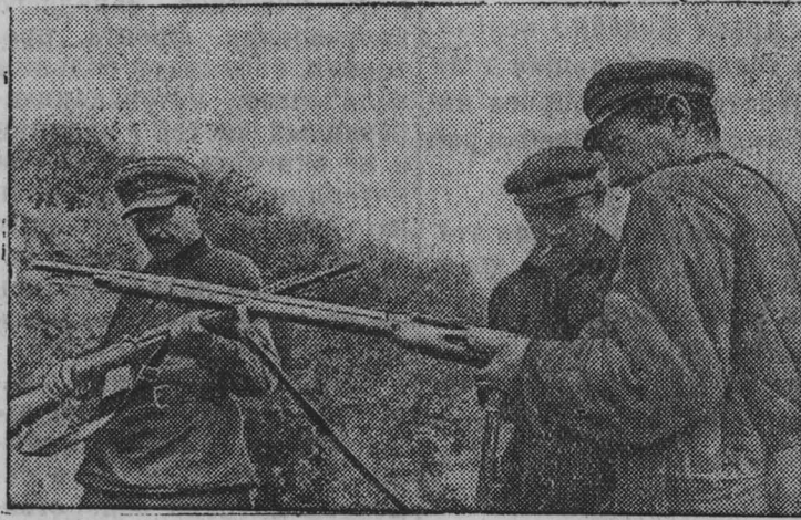
В тылу у врага. Партизаны получают оружие.