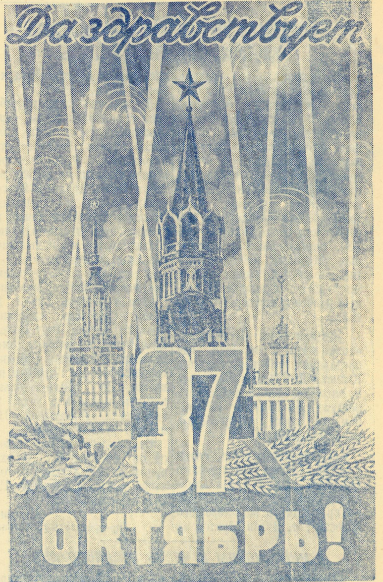
Плакат художника А. Антонченко, выпущенный ЦСОГИЗ.

Советские люди знают, что самоотверженный труд — лучший подарок матери — Родине в честь ее славного юбилея и не жалеют своих сил, укрепляя могущество советского государства, стоящего на страже мира во всем мире. Сегодня они первое слово сыновней благодарности и признания шлют своему вождю — родной Коммунистической партии. Во всех уголках страны, на всех языках народов СССР звучат слова: Да здравствуют Коммунистическая партия и Советское правительство!