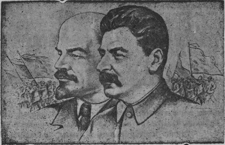
В. И. Ленин и И. В. Сталин.

Да здравствует XXIV годовщина Великой Октябрьской Социалистической революции, свергнувшей власть империалистов в нашей стране и провозгласившей мир между народами всего мира!