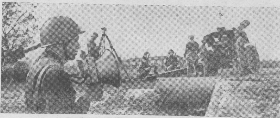
На снимке: подразделение тяжелых гаубиц на занятии.