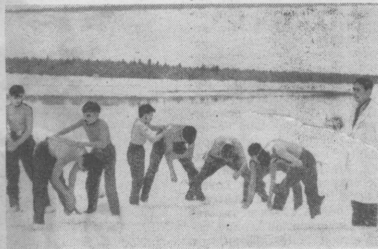
В одном из прошлых номеров нашей газеты уже сообщалось об овгортских «моржах» — воспитанниках школы-интерната.