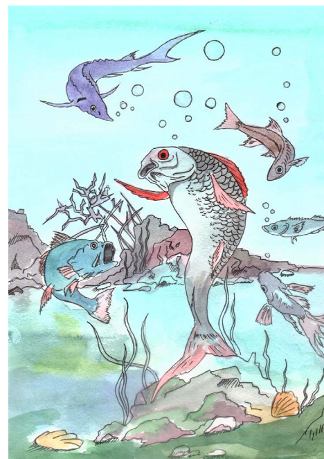
Полщаң келци (Леонид Лар вером хор)

Иса щи вуш элты лув мохиладн дыкан эттыя питса па полщаң кел-