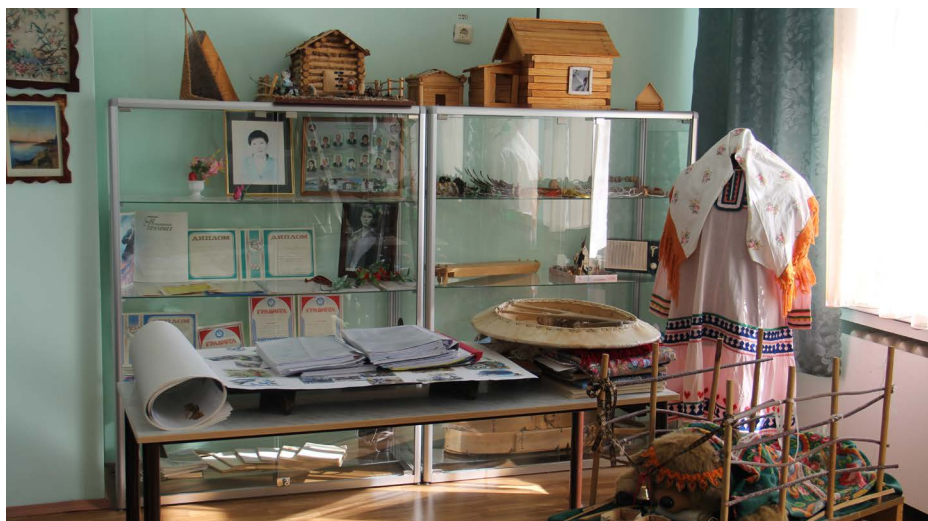
Ашкула музей хот йис пормасат