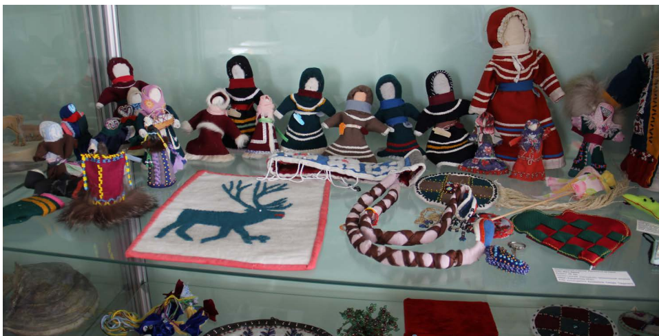
Шоши мир ху ёх аканят