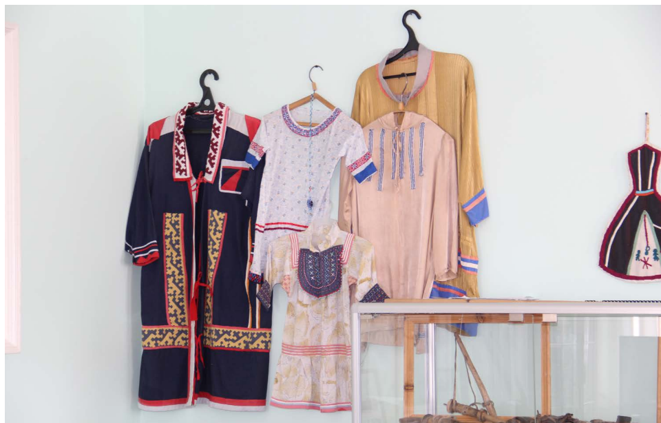
Аган мув ханты нэңат таём думатты сохат

– Ма щирэмн, шеңк умащ па хоятата мосты рупата тата тайлом. Ванта, муй щирн муң тамхатл няврэмат энмаллудв па лый пилэдн рупитлудв, щиты елды там похат па эвет ултыхолты щирлал лэщаттыя питлат.