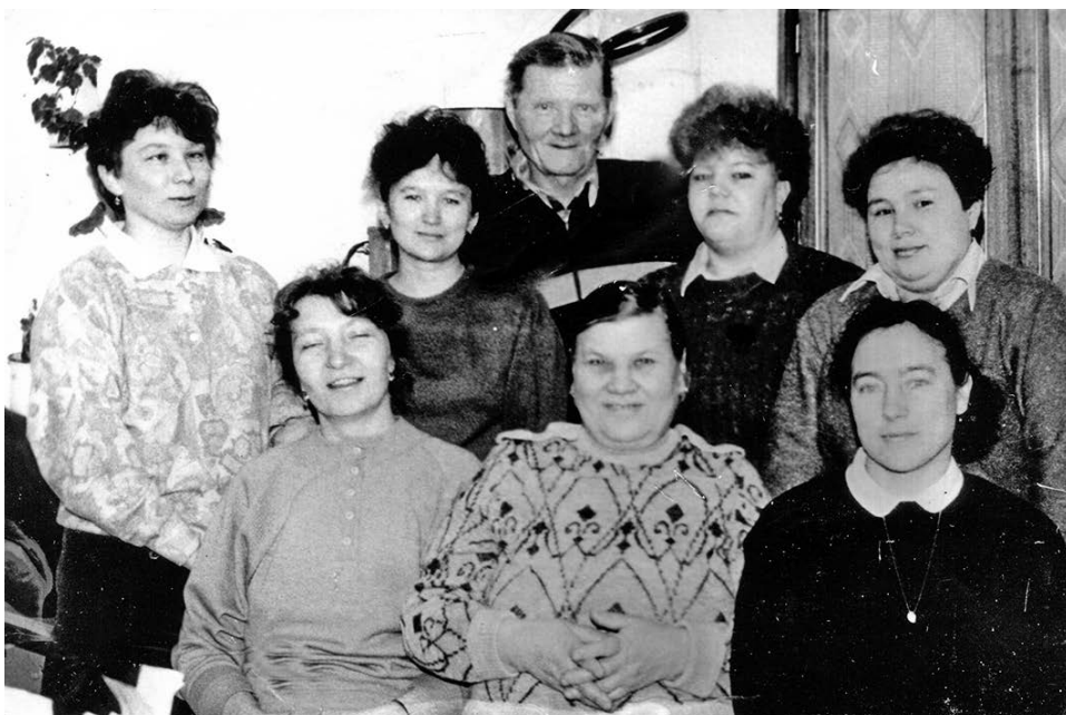
Код уна во поштаас рөбитісныс

1930 во вылас округын рөбитіс 5 почтово-телеграфнай агентстве. Поштасэ нолісныс вөбясэн да көрэн, мукеддырға челик да садуку пыр. Коомис уна кузь туй мунны мед грузсэ вайны местэас. Мыжысынь