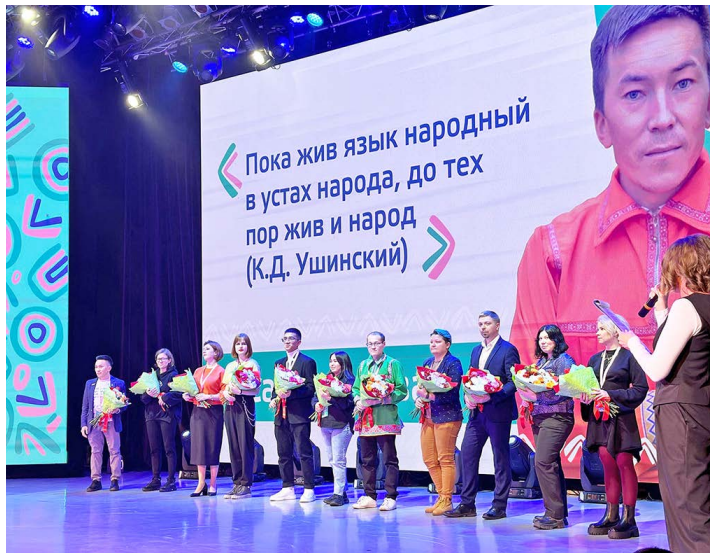
Ямал мув доват элты ияха ёхтам ханшатты энамты хоятат

Новый Уренгой ун вош. Щита сот щорс молтас хоятат улдат. Аратл рупатая елта ёхтам руц хоятат па па сыр рут хоятат. Вош хулатн шоши шимлаң рут мир хоятат – хантэт, урт па селькупат – ант и шиядалн. Сишн вошн улты няврэмат, арпелкал,