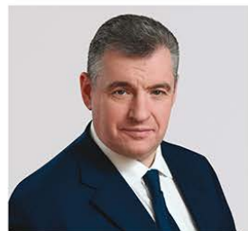
СЛУЦКИЙ ЛЕОНИД ЭДУАРДОВИЧ

1968 года рождения; место жительства – город Москва; Государственная Дума Федерального Собрания Российской Федерации, депутат, руководитель фракции Политической партии ЛДПР – Либерально-демократической партии России, председатель Комитета Государственной Думы по международным делам; выдвинут политической партией «Политическая партия ЛДПР – Либерально-демократическая партия России»; член политической партии «Политическая партия ЛДПР – Либерально-демократическая партия России»; Руководитель Высшего Совета партии, Председатель партии