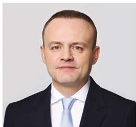
ДАВАНКОВ ВЛАДИСЛАВ АНДРЕЕВИЧ

1984 года рождения; место жительства – город Москва; Государственная Дума Федерального Собрания Российской Федерации, депутат, заместитель Председателя Государственной Думы, член Комитета Государственной Думы по бюджету и налогам; выдвинут политической партией «Политическая партия «НОВЫЕ ЛЮДИ»; член политической партии «Политическая партия «НОВЫЕ ЛЮДИ»; член Центрального совета партии