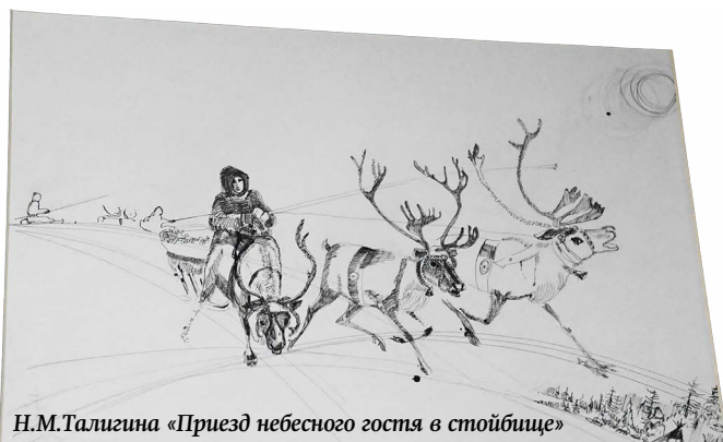
Н.М.Талигина «Приезд небесного гостя в стойбище»

Тамара Куляева.