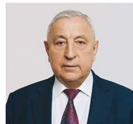
ХАРИТОНОВ НИКОЛАЙ МИХАЙЛОВИЧ

1948 года рождения; место жительства – город Москва; Государственная Дума Федерального Собрания Российской Федерации, депутат, председатель Комитета Государственной Думы по развитию Дальнего Востока и Арктики; выдвинут политической партией «Политическая партия «КОММУНИСТИЧЕСКАЯ ПАРТИЯ РОССИЙСКОЙ ФЕДЕРАЦИИ»; член политической партии «Политическая партия «КОММУНИСТИЧЕСКАЯ ПАРТИЯ РОССИЙСКОЙ ФЕДЕРАЦИИ»; член Центрального Комитета партии, член Президиума Центрального Комитета партии